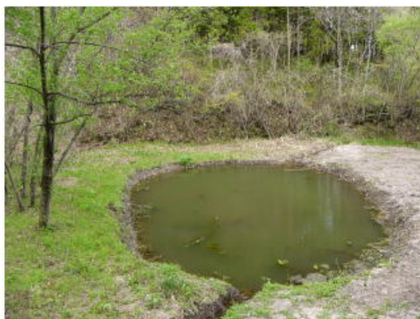
(写真-1) 湿地の復元実施状況