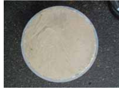
パルプスラッジを含むエアミルク