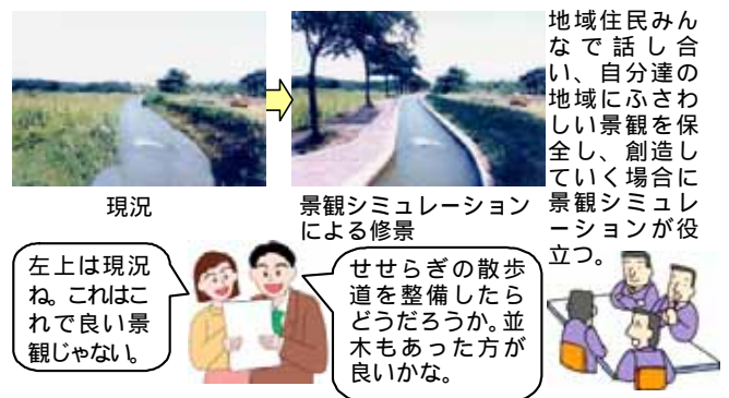
図4 住民参加による景観づくりワークショップで活用

立つのが景観であるから、景観シミュレータも画像データベースも、地域住民と話し合うためのコミュニケーションツールだと考えて、地域づくりの一環で、ワークショップ等に組み込み、技術者と住民が話し合いながら、学習利用すべきである。