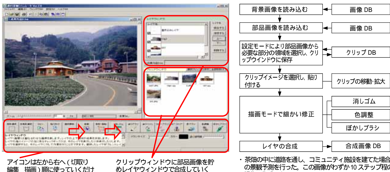
図1 景観シミュレータの作業の流れとインターフェイス

予測景観作成において、重要な概念となるレイヤによる部品画像管理機構をクリップウィンドウとレイヤウィンドウの2段構造として実現し、他のソフト