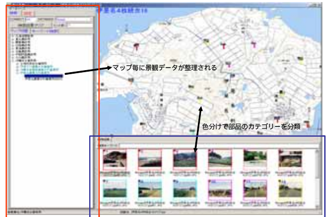
図2 景観画像データベースシステムのメイン画面