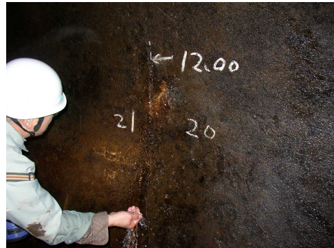
写真-3 バレル継目部漏水状況