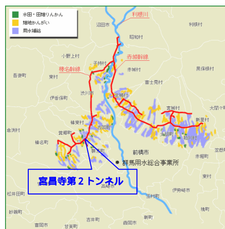
図-1 群馬用水の概要図