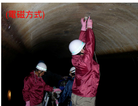
写真-4 衝撃弾性波測定調査状況

5m 間隔(一部 2.5m 間隔)の 10 測線についてトンネル内面天端部より衝撃弾性波を入射させ、その測定波形によりトンネル背面～地表面間の探査を行い、探査結果から背面地山状況の推定を行った。