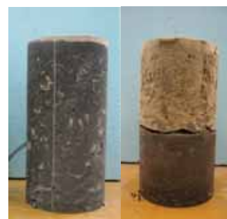
耐水施工型中込材 エアモルタル Fig. 4 水中打設結果 Result set underwater stroke

一般的に更生工法で更生管路とトンネルの中込材にはエアモルタルを使用するが、本施工箇所はクラックや既設打継目からの漏水が確認されており、その状況下で、エアモルタルを打設すると、材料分離を起こし、消泡することで空隙が発生する可能性がある。（左図 Fig.4 参照）その状態で、仮に大きな外水圧が作用すると、管に作用する座屈応力は非常に大きくなり、最悪の場合は大規模な管路の破壊を引き起こすこととなる。