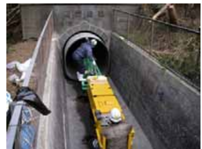
Fig.2 馬蹄形FRPM管運搬状況