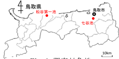
Fig. 1 調査対象地 The study area

中山間地域の多い鳥取県では小河川やため池が点在し、小規模な水力エネルギーが豊富であると考えられるが、特にため池の持つ発電量ポテンシャルに関する調査・分析は十分に行われていない。一方で、近年では農家人口の減少による水利費収入の減少、農家の高齢化によって、ため池の維持管理は経済的・物理的に困難になってきている。農業用水としてだけでなく、ため池の持つ多面的機能を保持するためにも、維持管理作業の省力化が望まれる。発電で得た電力はため池の維持管理作業の省力化・電化に利用し、その電力をため池から得ることは理想的で、エネルギーの地産地消の観点からも望ましいと言える。そこで、本研究では農業用ため池に焦点を当て、現行の取水管理に基づくマイクロ水力発電のポテンシャル推定とその評価、考察を七谷池(鳥取市久末)と松谷第一池(琴浦町赤碕)を対象に行った(Fig. 1)。各ため池の基本情報を Table 1 に示す。両ため池共に県内において総貯水量が大きく、灌漑期を通して安定した発電が期待できる。また、両ため池の取水時間が異なる点が、取水管理が発電量に与える影響を考察する上で好都合である。なお、本研究では、サイフォンによる取水を想定しており、発電機へのゴミの流入を軽減し、さらに、貯水による水位を落差として利用できる。