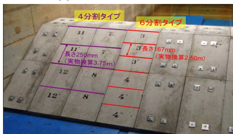
図-2 被覆ブロック式の防潮堤模型

4. 考察 津波が堤防を越流する際に、後ろ法肩部のブロックに揚力が発生し、ブロック下端部を回転端としてめくれ上がったと考えられる。また、4 分割ブロックよりも 6 分割ブロックの方が越流直後に流出したが、これはブロックの長さが短いほどめくれ上がりに対する抵抗モーメントが小さい、つまり、揚力に対する抵抗力が低かったためだと考えられる。しかし、い