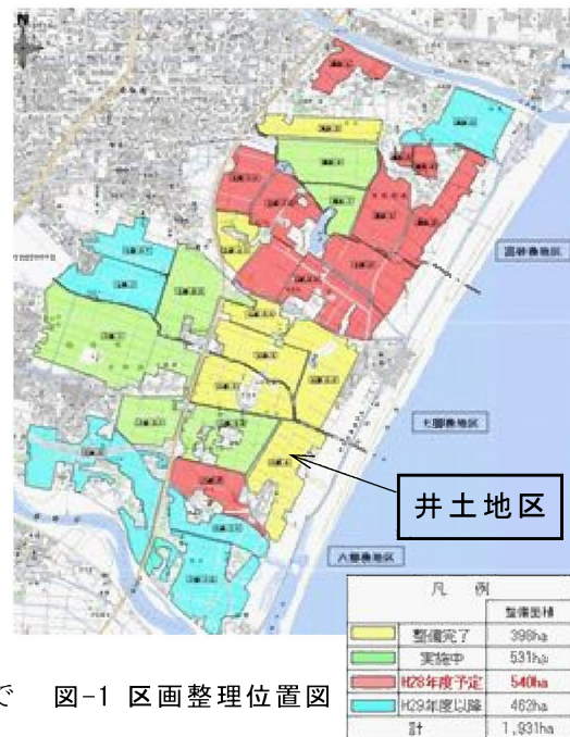
図-1 区画整理位置図

井土地区の津波高は約10mと言われ、井土集落で36人の命が失われ、農地や住宅に甚大な被害を与えるとともに農業機械も流出している。