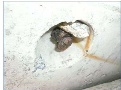
写真-1 アンカーの腐食状況

本堤防の復旧工事に着手した平成23年度時点では、改築後5ヶ年が経過した比較的新しい堤防であったにもかかわらず、ブロック四隅にある吊り上げ金具 (デーハーアンカー) のほとんどが腐食しており、約2.5tの大型ブロックの吊り上げは困難であった。(写真-1)