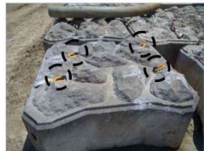
写真-2 ケミカルアンカー設置 (N=4本)

設置にあたっては、ブロックのかみ合わせ等を調整しながら設置する必要があるため、ブロック4箇所ケミカルアンカーを打込み、現地で引っ張り強度試験、吊り上げ試験を実施して施工を行った。(写真-2)