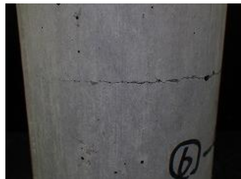
Fig.3 躯体部に生じた微細ひび割れ Micro crack in body of specimens

める試験方法の提案, 第 71 回農業農村工学会中国四国支部講演会, pp.82-84, 3)橋梅ら(2016):三軸圧縮試験によるコンクリート補修面のせん断強さの評価, 第 71 回農業農村工学会中国四国支部講演会, pp.79-81