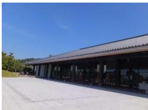
奈良春日野国際フォーラム 麓

2018 年 11 月 20 日～22 日、PAWEES の国際学会と併せて、第 15 回 INWEPF シンポジウム及び運営会議を、奈良県奈良市の「奈良春日野国際フォーラム 麓 ～I・RA・KA～」にて開催する。両組織の合同開催を通じて、水田・水環境に関する政策・技術・研究成果等を共有し、世界の水田農業発展のために有益な場にしていきたいと考えている。