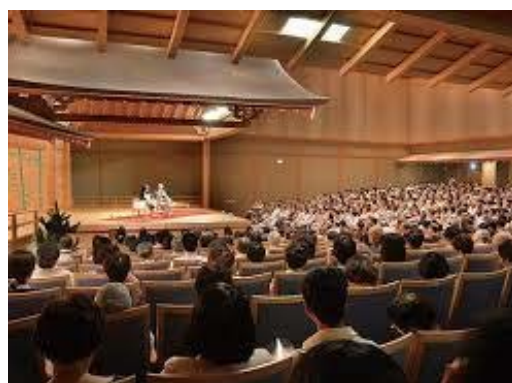
シンポジウム会場（能楽ホール）