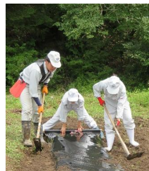
写真 1 作業風景 Work landscape

高校生の活動は、農地の管理以外に、①ビオトープ、花壇ならびに休憩施設の整備、②伝統野菜の栽培と活用、③獣害対策としての周辺環境整備など、状況に応じて創意工夫が重ねられ、生物多様性への配慮や、景観や環境の保全、地域特産品の活用に広がった。様々な課題に直面した時、家族から得た知恵や今までの経験を生かすとともに、新しい技術を調べその解決に取り組むなど、高校生が「生きる力」を発揮する貴重な機会となった。夏季休業中は作業が集中したが、自主的参加による授業外の課外活動が農地維持と活動発展の重要なポイントとなった。活動の継続と発展は、生徒の創造力や主体性によるところが強く、この力を生かす機会の創出が、地域産業の新規担い手や地域の後継者育成において重要な主題となると考える。