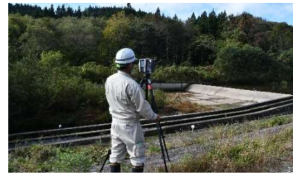
写真-1. 3D レーザースキャナー

謝辞 ：本研究の一部は、農林水産省スマート農業技術の開発・実証プロジェクト（うち国際競争力強化技術開発プロジェクト）「農地基盤のデジタル化によるスマート農業の機能強化技術の開発」により実施した。