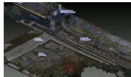
図-1. 全体モデル(点群+SfM モデル)