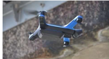
写真-2. 自律飛行型 UAV