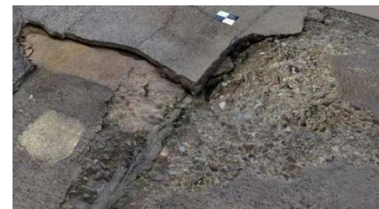
図-2. 損傷部位モデル(SfM モデル)