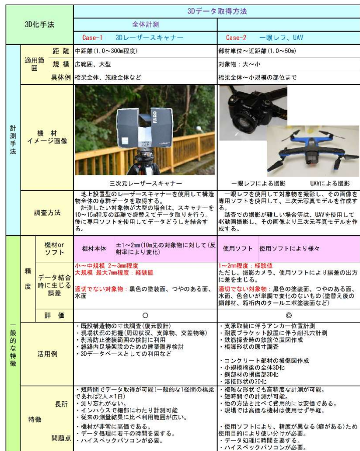
表-1 三次元データ取得機材とその特徴

一般的に現場の三次元データを取得するには三次元レーザー scanner で点群を取得する方法と、デジタルカメラで画像を取得し画像から三次元モデルを作成する方法がある。前者は広範囲のデータを短時間で取得し形状を把握することが可能であり、データ処理に費やす時間も短い。後者は対象物や調査目的に応じて画像を取得する手段を選べ、損傷などの詳細な状況把握や形状計測が可能である。ただし、得られる情報は多いがデータ処理に時間を要する。各々の特性に応じて使い分けが必要となる。