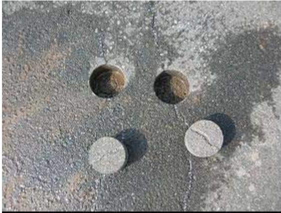
写真1 ひび割れ部で採取したコア(福島市)