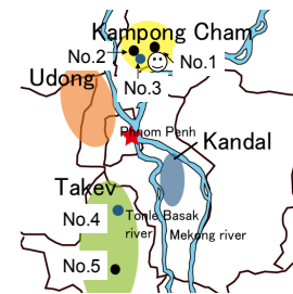
Fig. 1 二期作実施農村地点

1. 背景・目的 カンボジア・メコンデルタでは、毎年雨期時のメコン河及びその支流であるバサック川の増水により、後背湿地にて洪水氾濫が起こる。メコンデルタ氾濫域では、洪水の減水後に年に1回作付けをする減水期稲作が主に行われている。近年、カンボジアではベトナム経由での米の輸出が盛んなため、米は外貨獲得手段の一つとなり、今後もその価値が高まっていく可能性がある。そのため、洪水により畑作や果樹栽培が困難な洪水氾濫域での二期作の実現は、氾濫域農家の収入増に貢献するものと考えられる。また、カンボジアには現地語でタムノップ (Tum Nub) と呼ばれる、土手や堤防、堰堤が古くから数多く存在する。タムノップは洪水に対して若干の制御機能を持つ。そこで本研究では、氾濫域に適する二期作パターンの提示、新規タムノップの建設計画を例にタムノップの貯水機能を利用した水貯留システムの効果推定を目的とした。