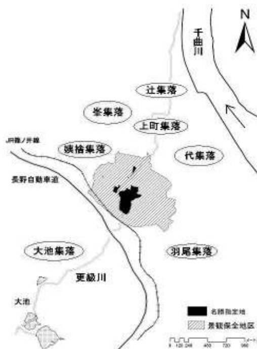
Fig-1 位置図 Locational map

景観保全地区を含む姨捨地域を受益、対象とするのが南沖土地改良区である。現在南沖土地改良区は、他の水系の2つの土地改良区と合併し、千曲市西部土地改良区となっている(理事・監事18名、総代45名)。しかし、旧来からの南沖土地改良区に関する業務は現在も引き継がれ、それに携わるのは、8名の理事・監事と15名の総代である。総代は、受益者数により8つの集落からそれぞれ1~4人が選出されている。これら総代により南沖土地改良区を所轄する理事・監事が選任されている。景観保全地区内の管理対象は、(1)水源である大池、(2)大池と棚田を結ぶ一級河川更級川である幹線水路、(3)受益地区内の水路及び農道である。これらの施設