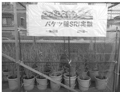
Fig. 1 バケツ稲の様子 Bucket rice experiment

(1)Dr.ドロえもんプロジェクト 3) (Fig.1): 国際情報農学研究室が小学生を対象に実施しているアウトリーチ活動である。バケツ稲の従来法とSRI農法による比較栽培を行いながら、土壌と作物の科学を啓蒙することを目標としている。 (2)バケツ稲: 市販のバケツに土を入れ稲を育てる方法で、場所を選ばずに手軽に行うことができるため学校や家庭で広く行われている。 (3)SRI農法: 近年発展途上国を中心に広まっている栽培方法で、種もみ・化学肥料・農薬・