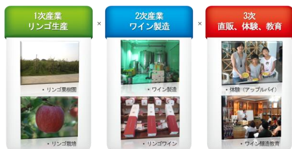
図2. 禮山リンゴワインの6次産業化

3次産業では、リンゴをテーマにした各種体験プログラム、オンラインなどでの直販している。