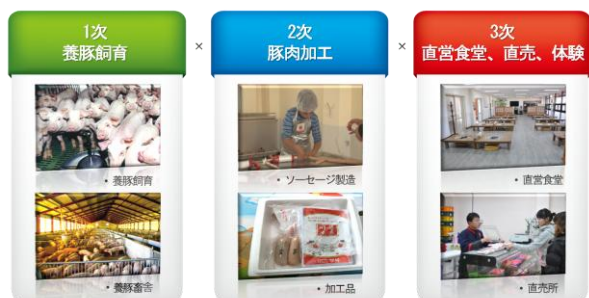
図3. 西部忠南高品質養豚の6次産業化

論山イチゴおばさん農園の6次産業の基本構造は、図4のように1次-イチゴ生産、2次-イチゴを加工しジャム、餅など製造、3次-直販、体験である。