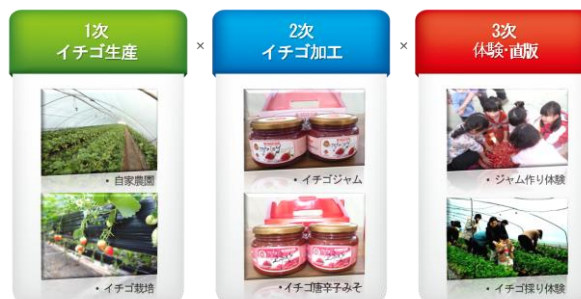
図4. 論山イチゴ農園の6次産業化

1次産業では、1haの直営(自家)農園でイチゴを親環境農法で生産している。2次産業では、100%自家農園で生産されたイチゴを加工してイチゴジャム、イチゴ唐辛子味噌、イチゴ餅などを製造する。3次産業では、イチゴをテーマにした各種体験プログラム運営、オンライン直販をしている。