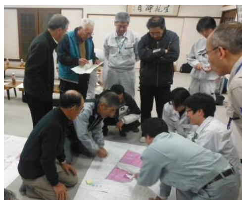
写真-1 ワークショップ実施状況