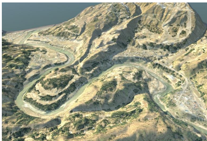
図2 栄村全村の3D現況図

検討をより具体的に進めるツールとしてAutoDesk社のソフト(Infrastructure)により、国土地理院提供の5mメッシュ数値標高モデル情報と、栄村の所有する空中写真オルソ画像を用い、まず当該地区における現況地形の3Dデジタルジオラマを作成した。ただし、上記メッシュ情報だけでは、水田の段差を表現できないため、水田のみ一筆毎の区画標高を補足入力し、区画間段差が描画できるようにもした(図2)。