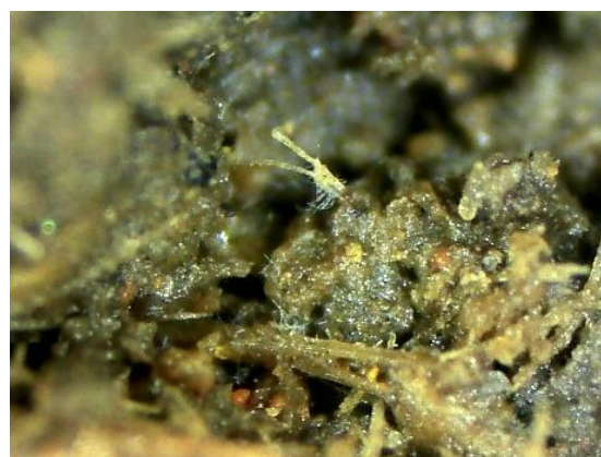
Fig.3 Image for inside of mixed sample with digital microscope