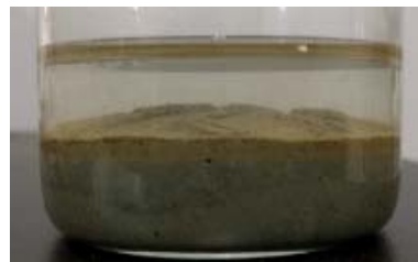
(2) Oxidative state of Case D HO