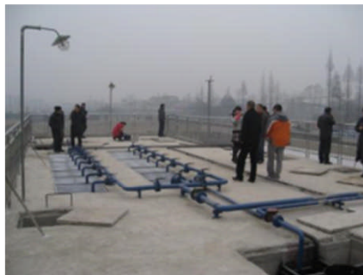
写真 1 モデル設置した連間法による処理施設 (400m 3 /日 左：概観 右：処理層の上部) A treatment facility by the intermittently aeration process installed experimentally in China