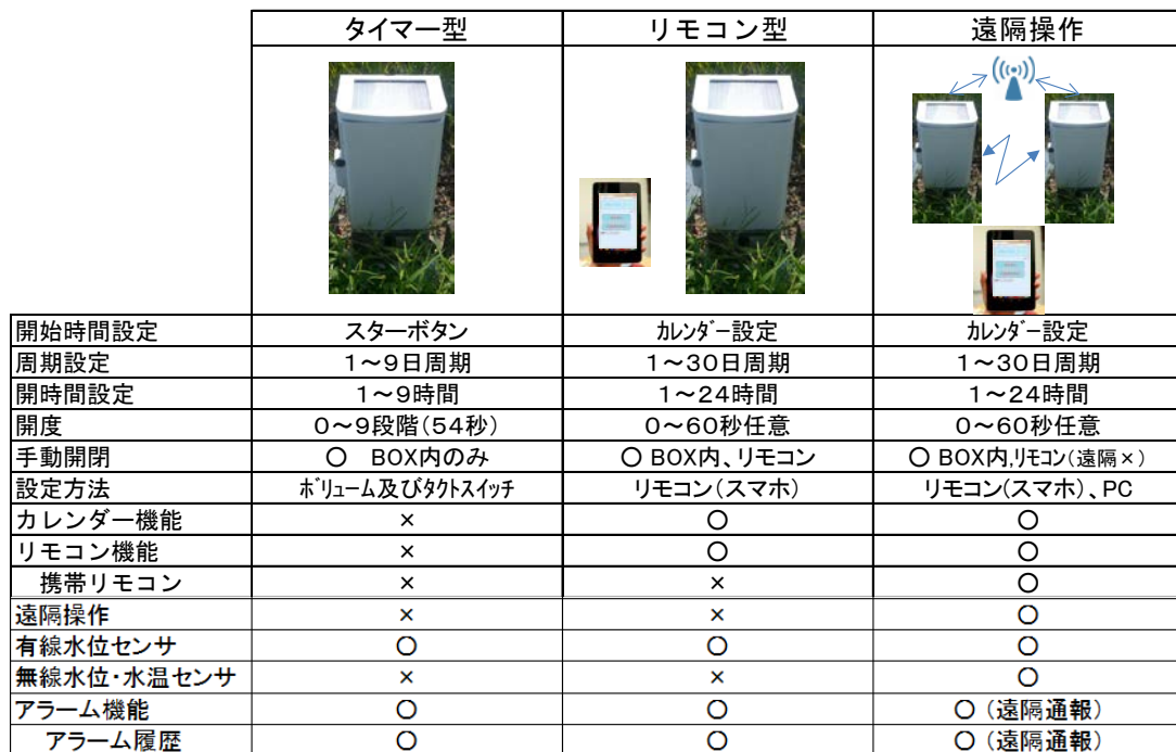
Table 1 多機能自動給水栓タイプ一覧及び主な機能