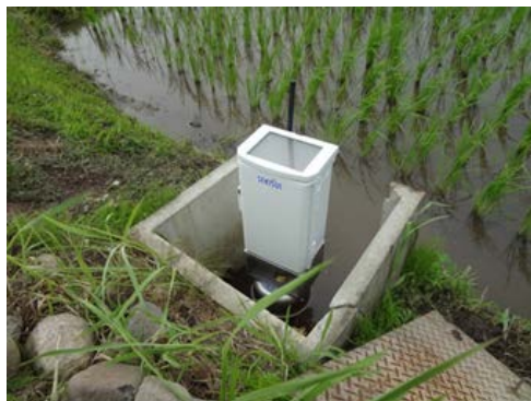
(長野県木島平村大塚沖土地改良区)