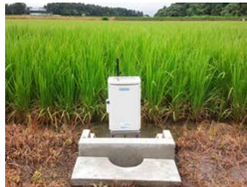
(福井県坂井市春江地区)