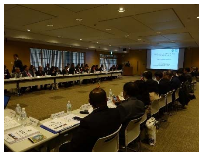
第 15 回 INWEPF 運営会議の状況