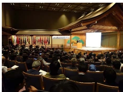
合同シンポジウムの状況

最後のラップアップミーティングにおいて、PAWEES、INWEPF の各議論の総括の後、SDGs の達成に向け、相互に連携を図り、環境と調和した持続的な水田農業の更なる発展に貢献していくことなどが盛り込まれた「PAWEES-INWEPF 奈良共同ステートメント」が採択された。