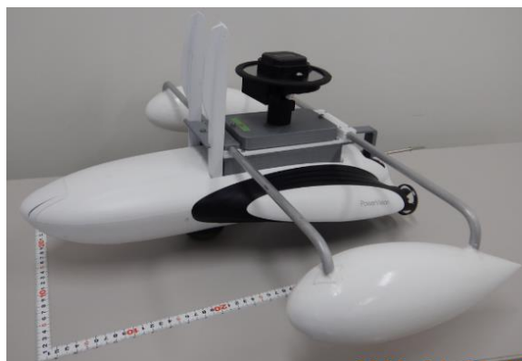
図 1 水上ドローン (Unmanned surface vehicle)

2.1 水深計測 水上ドローンに Power Dolphin (PowerVision 社)、魚群探知機に Deeper Smart Sonar Chirp+ (Deeper 社) を用いた。魚群探知機の計測可能深度は 15cm から 100m であり、1 秒間に最大 15 回水深計測を行うことができる。魚群探知機に内蔵されている GNSS の位置情報を利用することも可能であるが、測位精度を高めるために 2 周波の高精度 GNSS レシーバーである DG-PRO1RWS RWP (ビズステーション社) を用