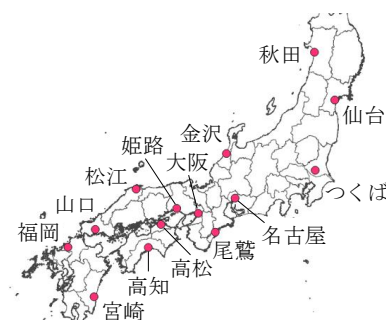
図 1. 対象とした観測地点 Location of objective meteorological stations

次に, 兵庫県高砂市内の A 池を事例に将来におけるため池設計洪水流量の変化について検討した. A 池の諸元を表 1 に示す. 土地改良事業設計指針「ため池整備」 2) では, 設計洪水流量は A 項流量, B 項流量および C 項流量のうち, 最も大きい流量を 1.2 倍したものと定められているが, 本研究では, 既往最大流量である B 項流量は除き, A 項流量および C 項流量について検討した. A 項流量の計算には姫路市で用いられている降雨強度式 3) を用い, 流出係数は 0.7 とした. 将来の A 項流量は, 高砂市に最も近い観測地点である姫路地点での降雨量変化倍率を降雨強度式に乗じることで求めた. 現在の観測値から計算される洪水到達時間は 57.6 分であったため, 降雨継続時間は 1 時間とした. C 項流量の計算には, 「土地改良事業計画基準 設計「ダム」技術書」 4) にて示されている