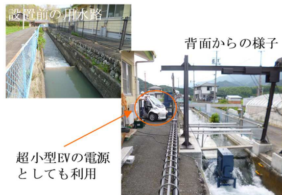
図-2 立梅用水での設置事例 Installation example of Taki Town