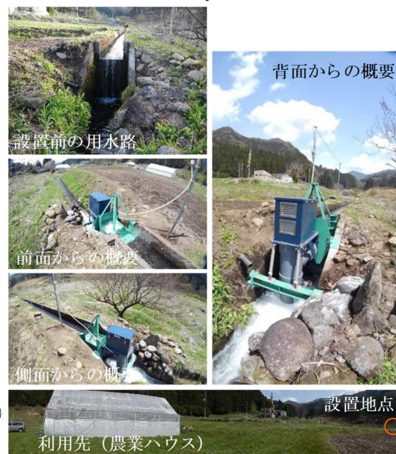
図-3 川場村での設置事例 Installation example of Kawaba Village