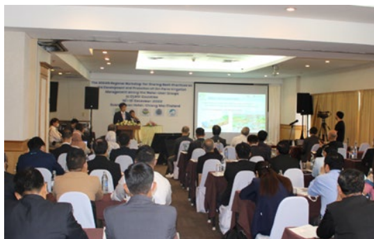
合同セッション会場

午後はWG3会合を開催し、参加したメンバー国等から、「水利用効率・水生産性の向上」に関連した各国の水管理に関する施策や施設整備に関する発表が行われ、意見交換を通じて相互の理解を深めた。