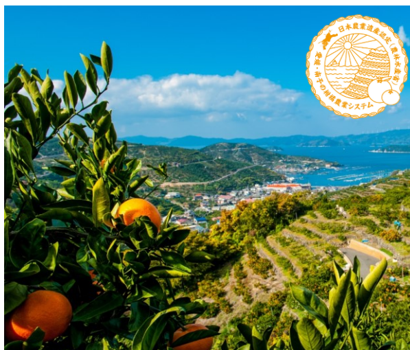
図1 ランドスケープ（八幡浜市）

日本有数のリアス海岸である宇和海沿岸部は古くから好漁場として鰯漁が盛んであり、漁業を営む漁師たちが、芋や麦などの生活の糧を求めて背面の山を開墾して急傾斜地農地を形成した。農地が急傾斜地に立地しているため、太陽の直達日射が園地全面に降り注ぐとともに、沿岸部に立地することから宇和海の海面からの乱反射が柑橘の樹木を下からも照らし、斜面であるがゆえに水はけも良いという柑橘栽培